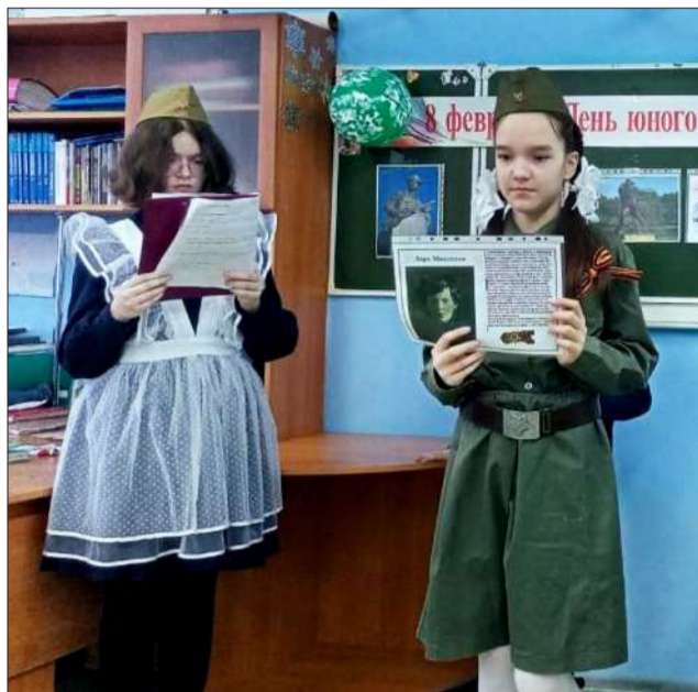
Ребята выступили с рассказами о подвигах юных героев.

С 1964 года по предложению юных интернационалистов Москвы, ежегодно, 8 февраля, отмечается День юного героя-антифашиста. Вот уже 60 лет в этот день мы вспоминаем массовый героизм детей и подростков в годы Великой