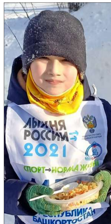
Горячий плов возвращает энергию и согревает в самый сильный мороз.

и скромная, но по рассказу сына и невестки сильная духом и увлекающаяся женщина. Она любит спорт, с удовольствием бегаёт, занимается на турнике, а вот на лыжи встает не часто, но выиграть гонку ей было несложно.