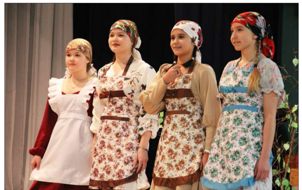
Театральный коллектив СОШ с. Бикеево.

Выступления были разнообразными, с песнями на родном языке и танцевальными номерами. Актерская игра и старания ребят покорили жюри. Ребята с руководителями тщательно подготовили костюмы и