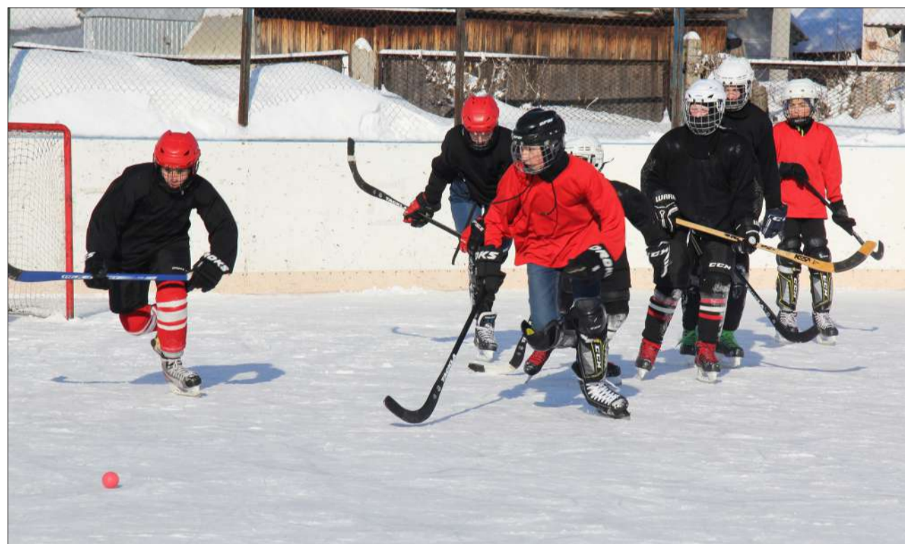
Самым зрелищным стал матч между командами гимназии и пятой школы.